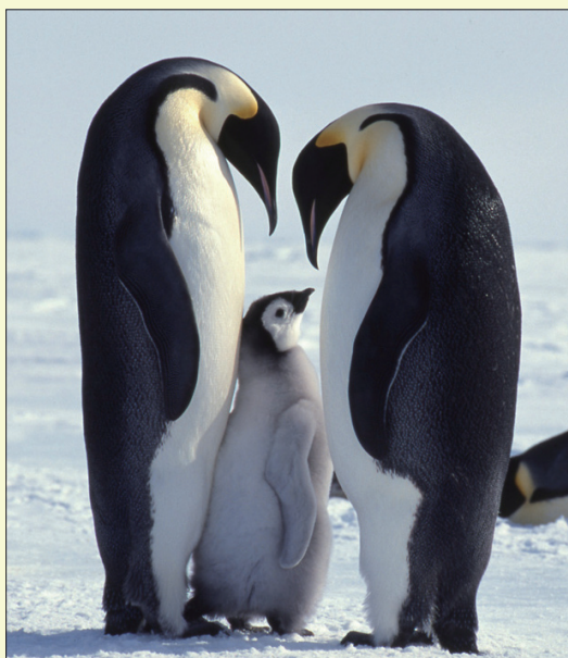
南極大陸 コウテイペンギン写真集 撮影: 内山晟 定価: 540 円

撮影は動物写真家の第一人者の内山晟。南極大陸で撮ったペンギンたちの写真が全 84 ページ。